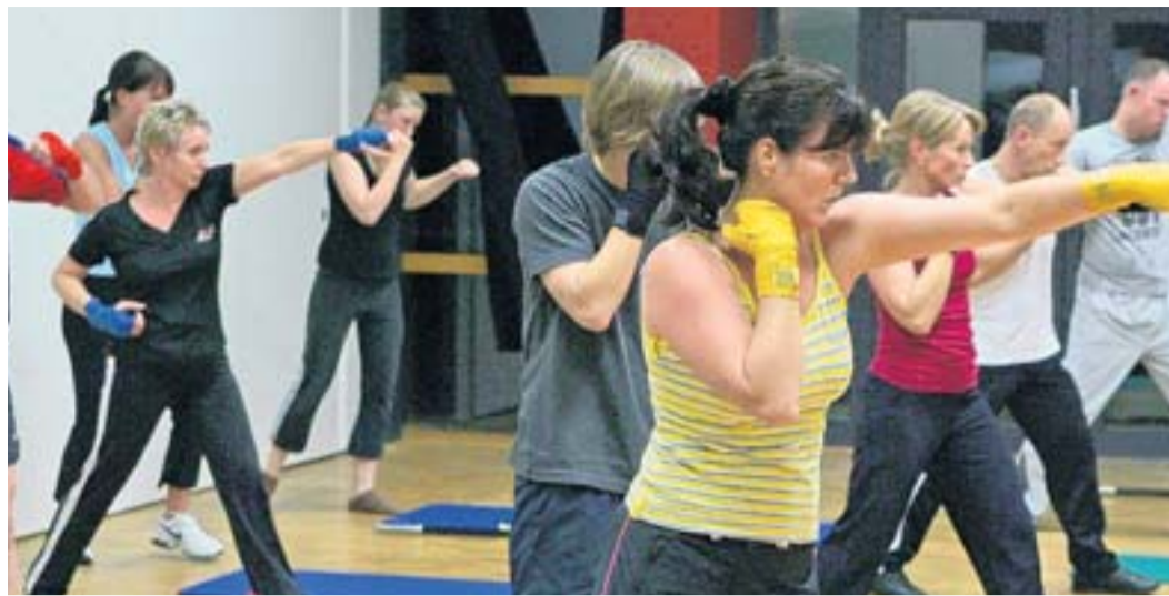
Kampfsportarten sind der Renner im Gesundheitszentrum der SG Kaarst.

Dormagen. Das Unternehmen Ineos mit Sitz im Chempark weist darauf hin, dass es bis Samstag, 8. Mai, erneut immer wieder zu Hochfackeltätigkeiten kommen kann. Grund ist die auf Halblast produzierende Anlage, die nach einem Vorfall herunter und jetzt wieder hochgefahren werden soll. Dabei wird überflüssiges Spaltgas verbrannt, was als Flamme zu sehen ist. Die Fackeltätigkeit ist laut Ineos ungefährlich. Red