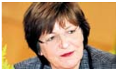
Bundesgesundheitsministerin Ulla Schmidt (SPD).

BERLIN (avg) Die Bundesregierung lehnt die von Ärzten geforderte höhere Praxisgebühr strikt ab. „Es wird keine höheren Zuzahlungen und keine höhere Praxisgebühr geben. Da ist nichts geplant“, ließ SPD-Bundesgesundheitsministerin Ulla Schmidt über einen Sprecher ausrichten. Zuvor hatte die Kassenärztliche Vereinigung Nordrhein in unserer Zeitung fünf bis zehn Euro Praxisgebühr pro Arztbesuch verlangt. Derselbe Betrag müsse für eine Überweisung