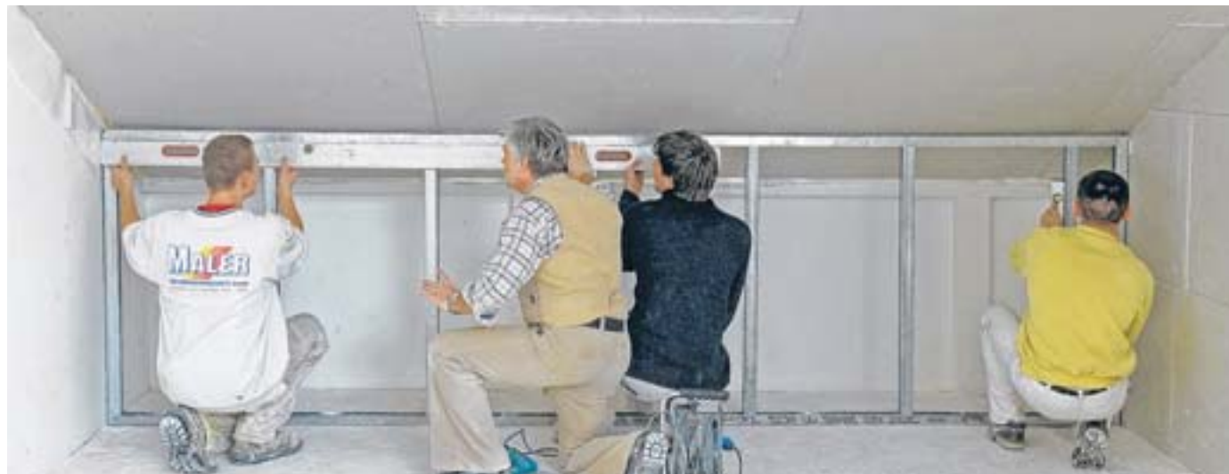
Nicht jeder Dachboden eignet sich zum Ausbau: Teilweise fehlt es an genügend Fläche mit ausreichender Höhe.

„Auch die Art des Dachtragwerkes entscheidet über den Ausbau und die spätere Nutzung“, sagt Ulrike Heuberger. Räume unter Sparrendächern