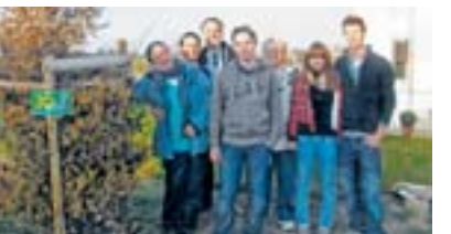
Grüne pflanzen einen Baum.

DRIESCH (NGZ) Die Grünen haben auf dem Spielplatz am Haindörnchen eine Hainbuche gepflanzt. Der mehr als drei Meter hohe Solitärstrauch soll sich in ein paar Jahren als Kletterbaum eignen. Mit der Aktion wollten die Grünen ihren praktischen Beitrag zur Errichtung des Spielplatzes leisten, für den sie sich seit Jahren eingesetzt haben.