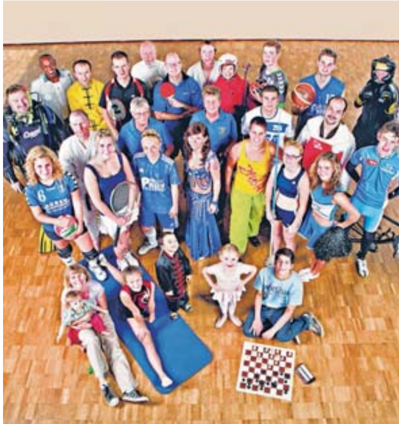
24 Abteilungen, 24 verschiedene Sportarten: Die SG Kaarst ist im Laufe der Jahre immer weiter gewachsen.

Indoor Cycling Marathon Beim Indoor Cycling wird Rad gefahren – nicht draußen in freier Natur, son-